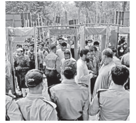
Yesterday marked the last Friday of the Amar Ekushey Boi Mela. As per expectation, owing to the weekly holiday, visitors crowded the premises since morning. With only four days left till the fair ends, many visitors are now rushing to the fair to buy their favourite books. Meanwhile, security was also beefed up.