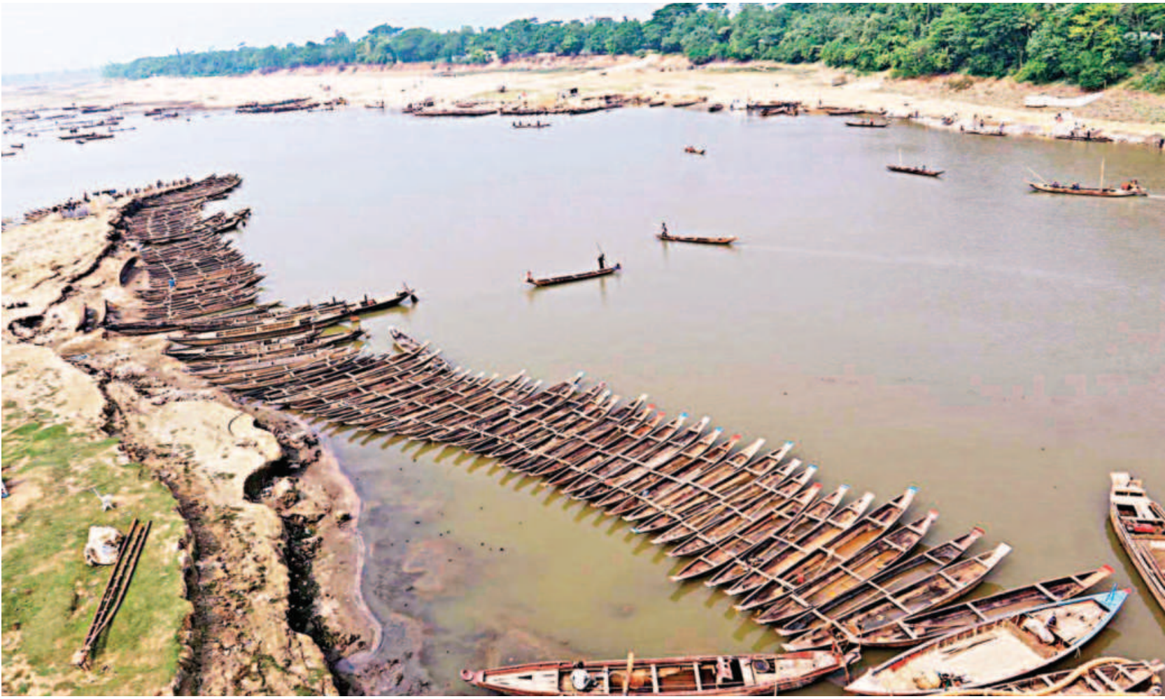
Boats have been lying idle near the banks of the Piyain river in Sylhet's Jaflong for days. The river has lost much of its navigability as its water, which flows in from India's Meghalaya, brings in a lot of sand and stones along with it – all of which has been collecting in the riverbed. As a result, boatmen and other locals, who rely on the river to make a living, have been heavily affected. The photo was taken at the Jaflong bridge yesterday.