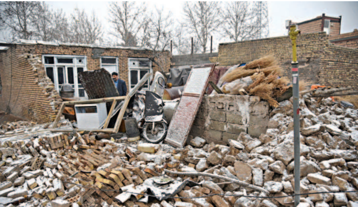
A picture shows the damage after an earthquake struck the city of Khoy in Iran’s West Azerbaijan province yesterday. The 5.9-magnitude earthquake struck northwest Iran near the border with Turkey late Saturday, killing at least three people and injuring 816, state media said.

AFP, Tehran Iran yesterday said a night-time drone attack had targeted a defence ministry site, at a time of high tensions over its nuclear programme and Russia’s war in Ukraine. An anti-aircraft system destroyed one drone and two others exploded, the ministry said, adding there were no casualties and only minor damage to the site in the central province of Isfahan. A fireball lit up the night sky in video footage widely shared on social media and published by Iranian state media, with people outside seen running and emergency service vehicles speeding toward the site. “An unsuccessful attack was carried out ... on one of the workshop complexes of the ministry of defence,” the ministry said, according to state news agency IRNA. “The attack, which occurred around 11:30pm (2000 GMT), did not cause any disruption to the operation of the complex,” it said. A few hours before the Isfahan attack, a major fire broke out at a motor oil production plant in the northwestern province of East Azerbaijan, IRNA reported. Images of the huge blaze in the key industrial complex linked to the Ministry of Industry were published by the agency.