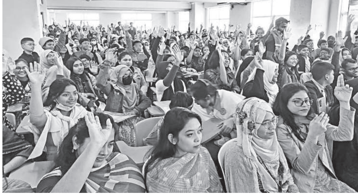
The regional round of season 3 of The Daily Star Newspaper Olympiad was held at University of Global Village in Barisal yesterday. A total of 398 students from Barisal participated in the event. Of them, 50 participants will be selected for the finale in Dhaka on March 20, where they will compete with 1,200 participants from across the country.