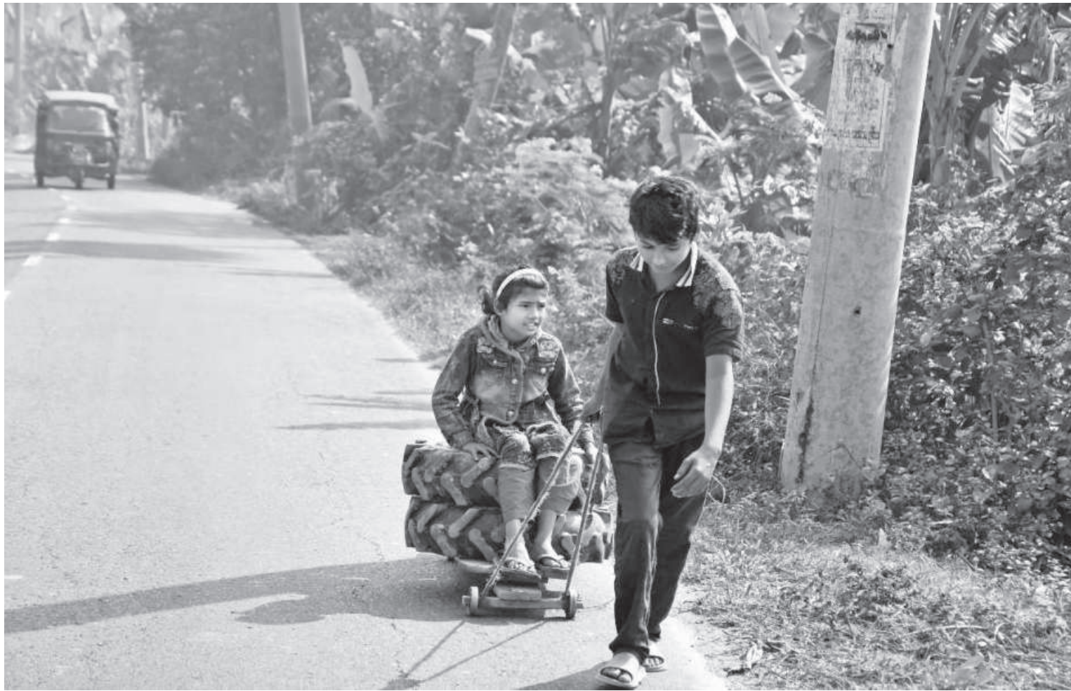
A girl sits on tyres placed on a wooden plank while her brother pulls it with the help of a rope. Such simple joys of childhood have now become a rare scene in the urban landscape. This photo was taken in Barishal's Babuganj upazila recently.