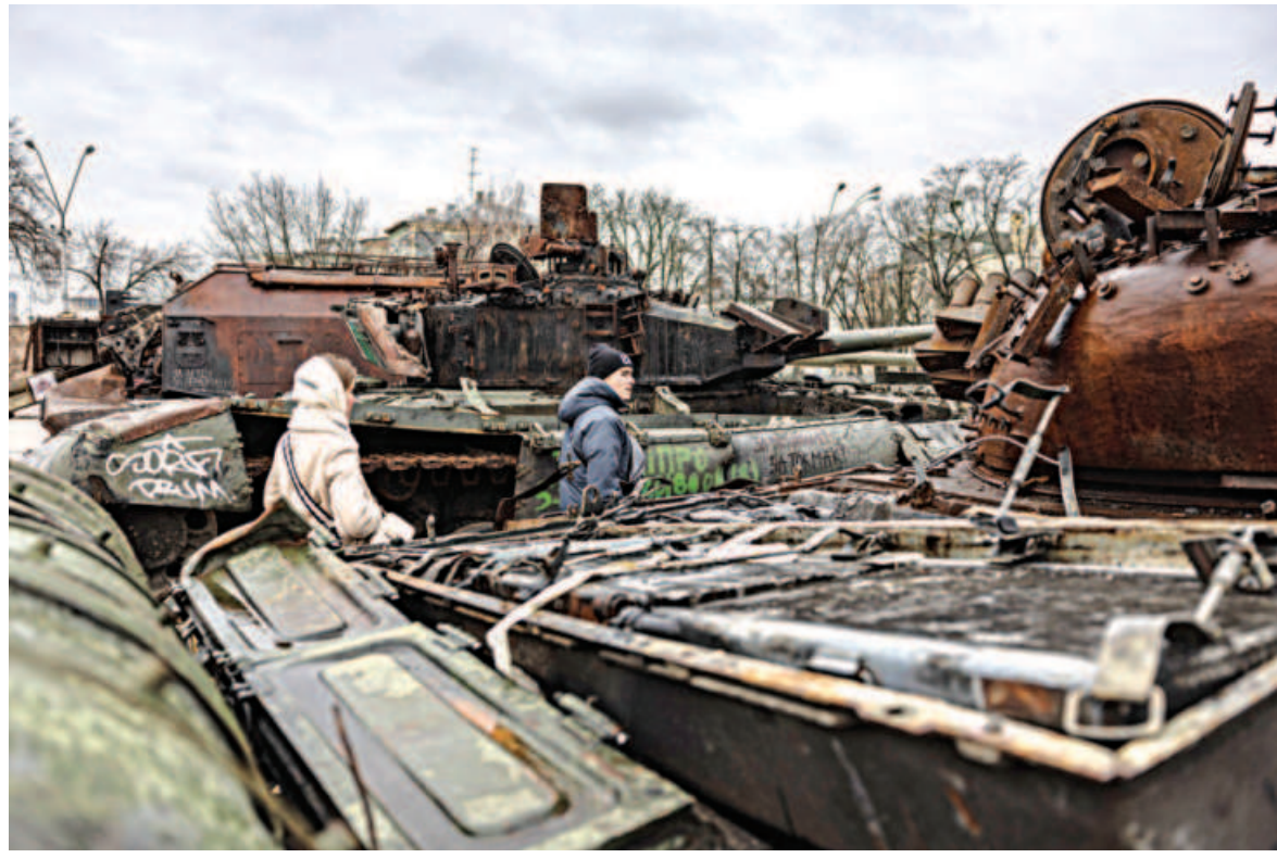
Pedestrians look at the destroyed Russian military vehicles at an open air exhibition of destroyed Russian equipment in Kyiv, Ukraine.

Earth has warmed more than 1.1 degrees Celsius since the late 19th century, with roughly half that increase occurring in the past 30 years, the World Meteorological Organization said in a report in November.