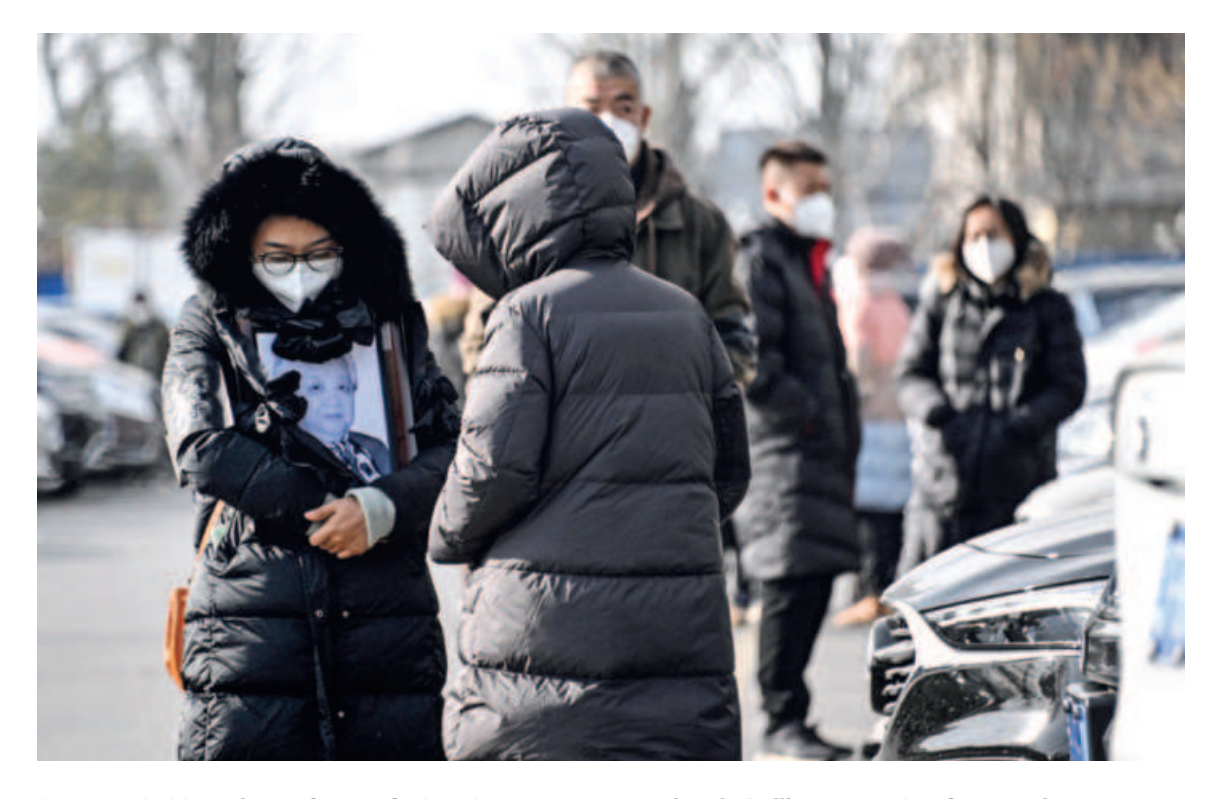
A woman holds a picture frame of a loved one at a crematorium in Beijing, yesterday. Crematoriums across China are straining to deal with an influx of bodies as the country battles a wave of Covid cases. Chinese authorities earlier this month lifted years-old Covid restrictions facing widespread protests.

The police station is within a cantonment area in Bannu, adjacent to the border with Afghanistan.