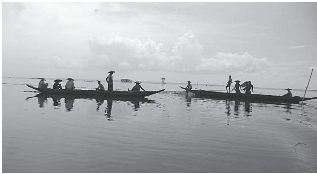
Monitoring and management of wetland ecosystems such as Hakaluki Haor is one of the key goals of Bangladesh National Adaptation Plan.

The NAP identified 21 interventions related to NbS, requiring USD 5.9 billion. Most are related to