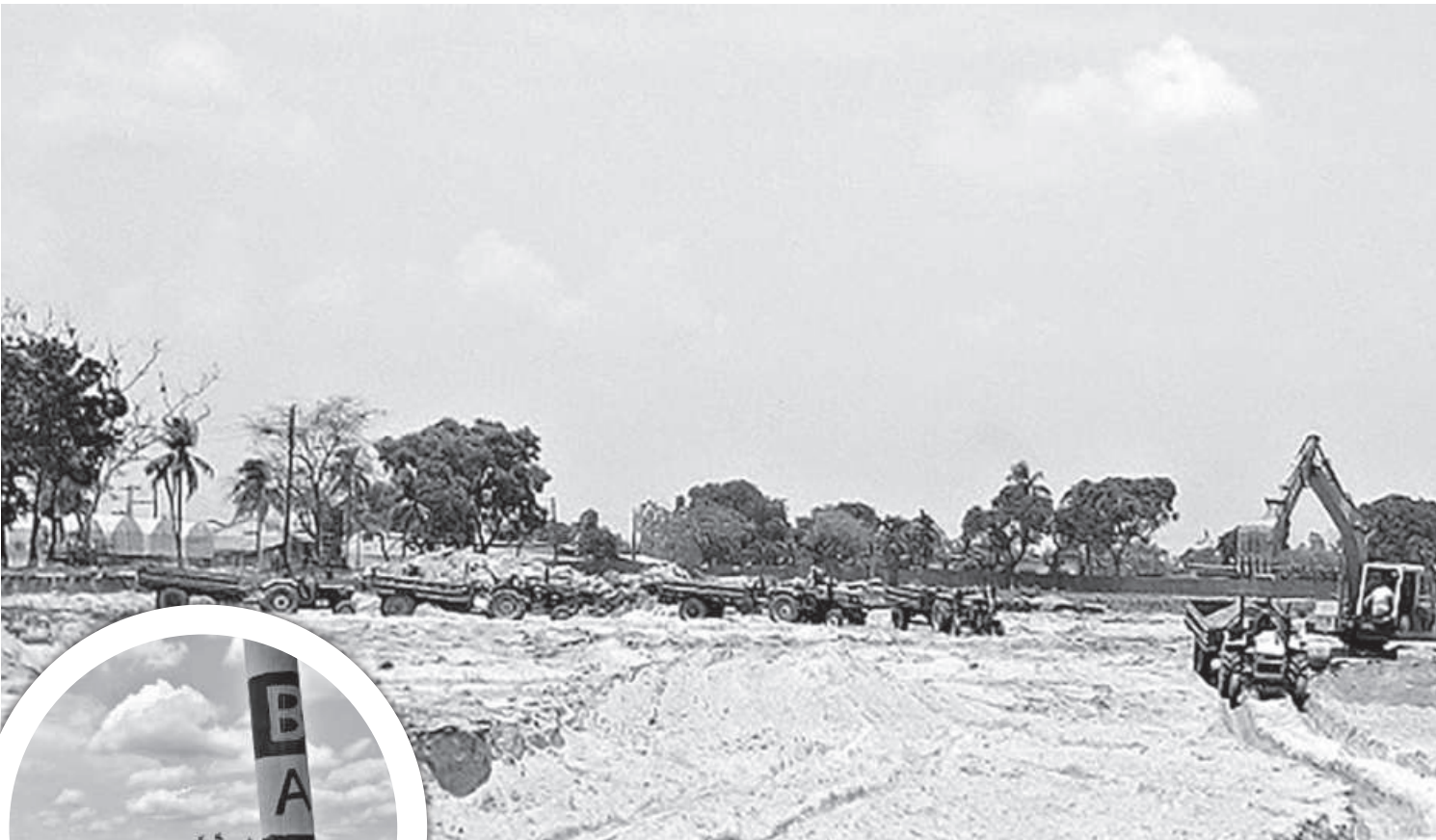
Domar Foundation Seed Potato Production Farm of Bangladesh Agricultural Development Corporation (BADC) was getting ready to welcome a boost in seed potato production, as authorities were supposed to make its land more suitable for cultivation. Even though a fund was allotted to get the required earth from outside the farm, contractors with the farm authorities' approval, instead dug a deep ditch right inside the farm, allegedly to keep a part of the fund in their pockets.