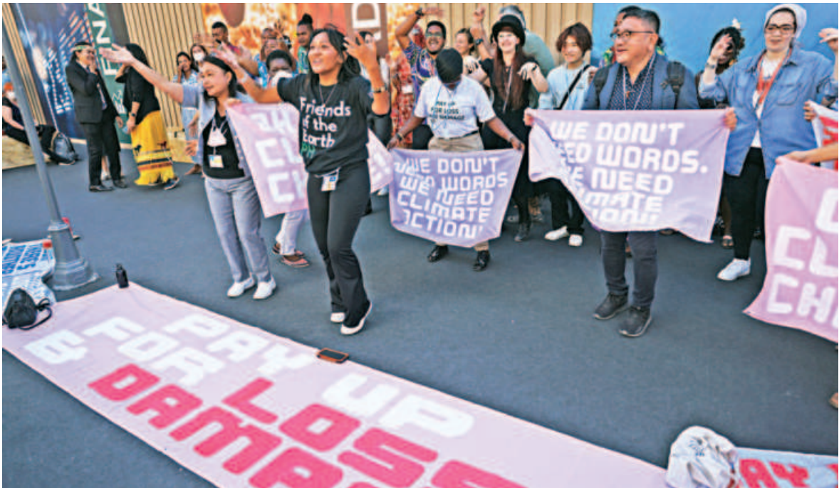
Climate activists demonstrate at the Sharm el-Sheikh International Convention Centre, in Egypt's Red Sea resort city of the same name, during the COP27 climate conference, yesterday.

“It has never been a question of who pays for loss and damage, because we are paying for it,” he said in recorded remarks at the summit in the Egyptian resort of Sharm El-Sheikh. “Our economies pay for it in lost growth prospects, our enterprises pay for it in business disruption, and our communities pay for it in lives and livelihoods lost.” He said he hoped the project would help the most vulnerable communities but also aid wider understanding of the challenges emerging economies face as they are being hammered by climate-induced floods, heatwaves or droughts. A first group of nations that will benefit from the scheme includes Bangladesh, Costa Rica, Fiji, Ghana, Pakistan, the Philippines and Senegal. Nations at the COP27 agreed this year for the first time to include the thorny topic of loss and damage on the formal agenda, after years of reluctance from richer polluters wary of creating open-ended liability. Germany said the Global Shield scheme would be part of a broader effort to respond to loss and damage.