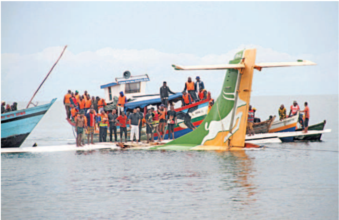
Rescuers attempt to recover the Precision Air passenger plane that crashed into Lake Victoria in Bukoba, Tanzania, yesterday. The plane had crashed into the lake as it attempted to land in the lakeside town of Bukoba, killing at least 19 people. The Precision Air flight was carrying 43 people, an official said.