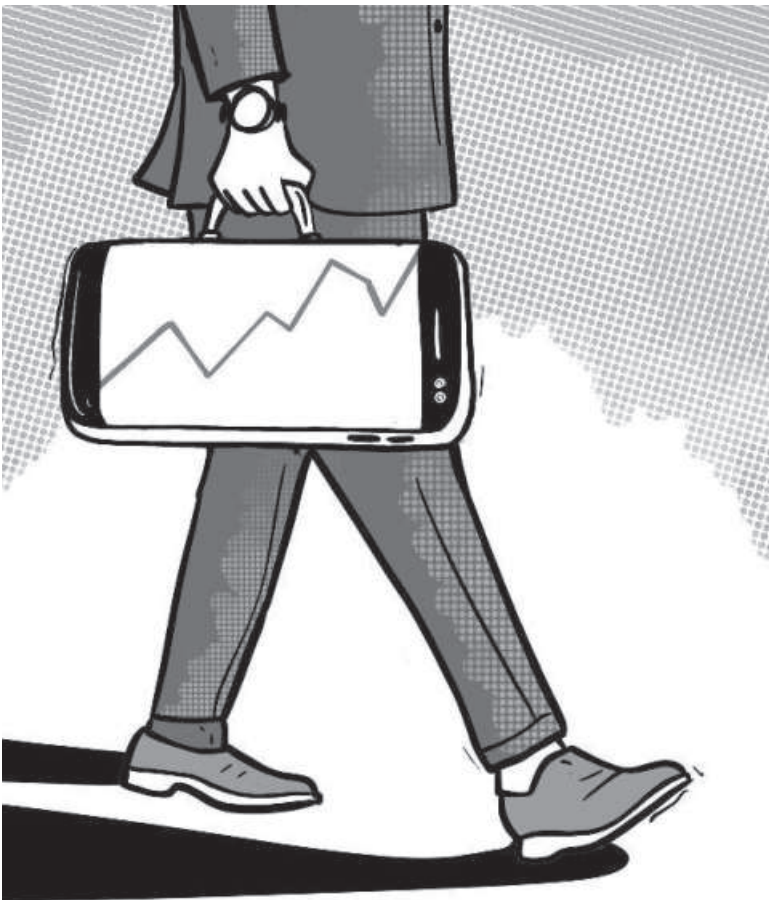
and technologies take time to groom, there are plenty of technical graduates to go around. Bangladesh has one of the largest pools of engineering graduates in the world and even in South Asia. These graduates have the fundamental academic learning to be trained in the required tools easily. Technical managers take longer to groom and can be a challenge for a start-up. The ICT Division, in collaboration with industry associations, is addressing the human resource issue in a persistent manner and has many

Bangladesh's very low score in human capital is mysterious. While it is true that technical human resources skilled in the latest tools