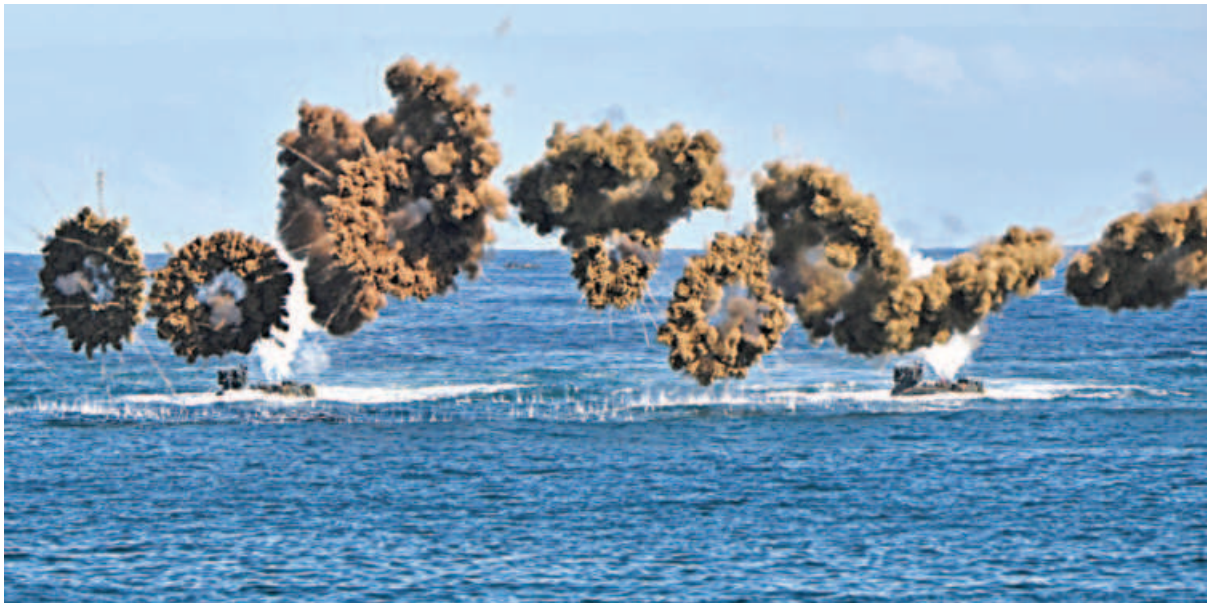
South Korean Marine amphibious assault vehicles fire smoke shells to land on the seashore during a landing operation as part of the annual Hoguk military exercises in Pohang, south Korea, yesterday. The United States, Japan and South Korea yesterday warned that a North Korean nuclear test would warrant an “unprecedentedly strong response”, vowing unity after a blitz of missile launches from the hermit state.