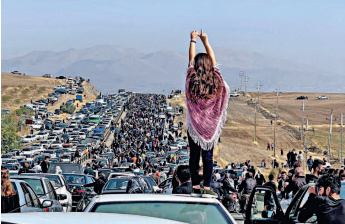
This UGC image posted on Twitter yesterday shows an unveiled woman standing on top of a vehicle as thousands make their way towards Aichi cemetery in Saez, Mahsa Amini's home town in the western Iranian province of Kurdistan, to mark 40 days since her death, defying heightened security measures.

That report was signed off by the same governments that will return to negotiations in Egypt.