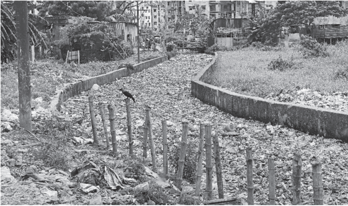
Most of the canals in Dhaka are in such terrible states that they are barely recognisable.

DAP also provides conditional construction rights in 28.86 percent of the area identified as agricultural land, allowing the construction of