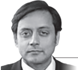
The 136-year-old Congress finds itself at a crossroads following several successive election defeats.