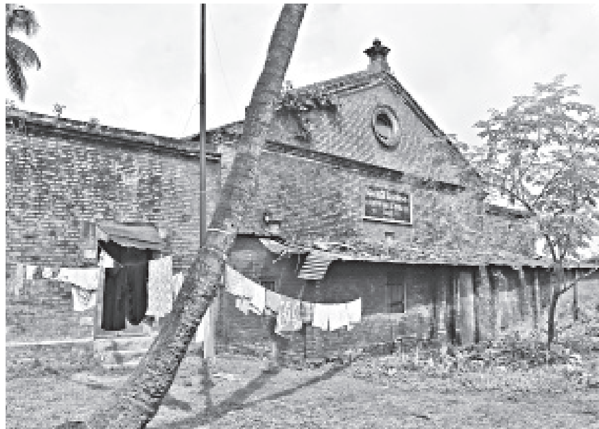
Fida Ali Auditorium for Saidpur's railway workers lies in a dilapidated state, depriving workers of recreational facilities. The auditorium used to be abuzz with activities, but now it remains neglected due to indifference of the authorities concerned.