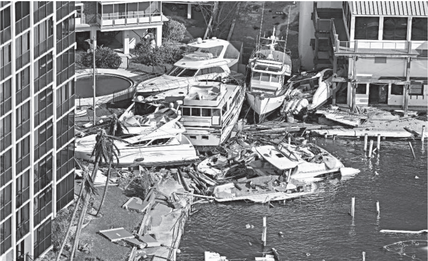
An aerial view of boats crashed in a harbour after Hurricane Ian caused widespread destruction in Fort Myers Beach, Florida, US, on Thursday. NBC News reported that at least 10 people had died, while CNN put the toll at 17 as of late Thursday.

The extent of damage in Florida, where Ian first came ashore on Wednesday as one of the most powerful storms ever to hit the US mainland, became more apparent on Thursday as emergency crews began reaching stranded residents. The death toll remains uncertain.