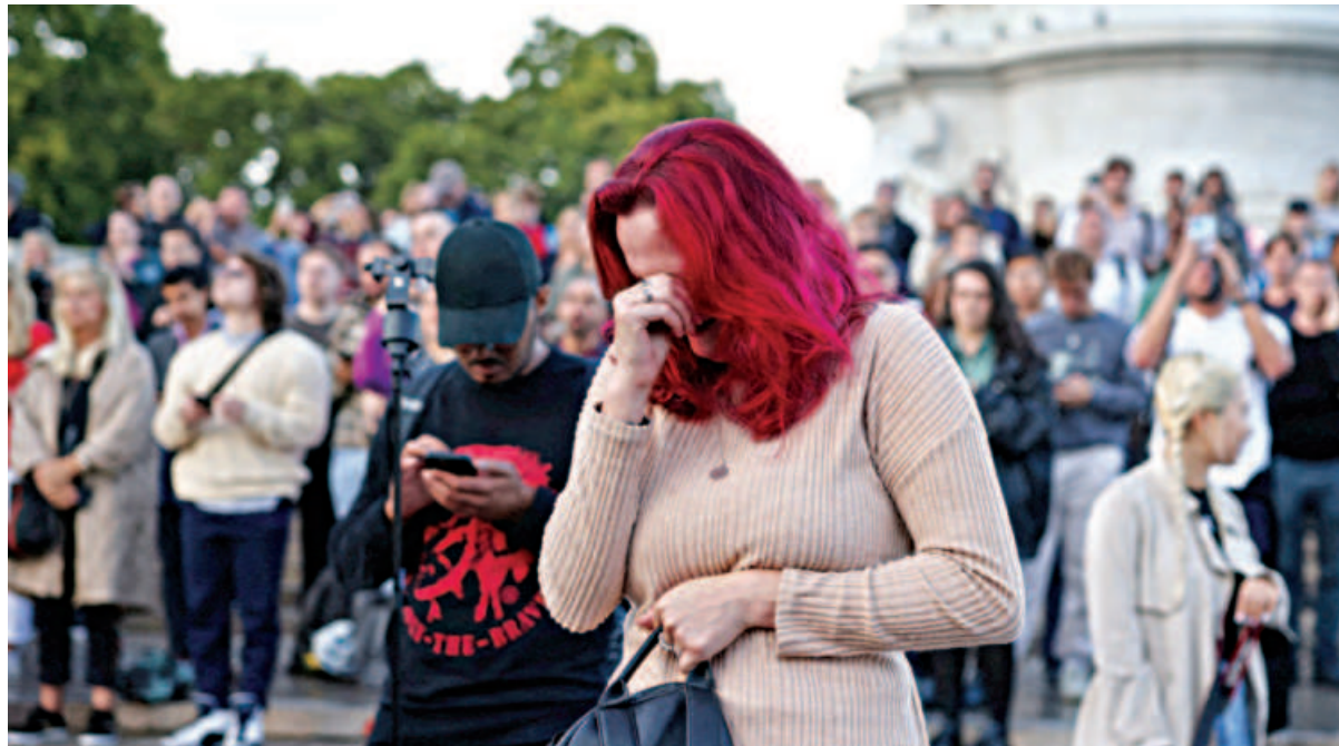
A woman reacts outside the Buckingham Palace, after Queen Elizabeth II, Britain's longest-reigning monarch and the nation's figurehead for seven decades, died aged 96 in London, Britain, yesterday.

Despite various scandals within the royal family, the monarch herself remained hugely popular and admired, an embodiment of traditional values and all that seemed eternal about England.