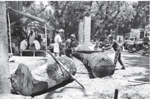
MIRZA SHAKIL, Tangail

Tangail municipality felling old trees to widen road amidst protests