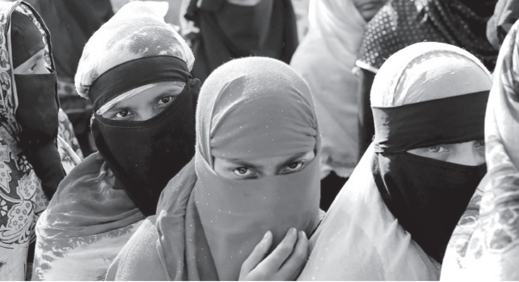
Over the last four years, polygamy has increased in Rohingya refugee camps due to the social, cultural, and religious dynamics of the community. This was not the case when they were in Myanmar.

As per the dominant belief of the Rohingya community, a woman under the supervision of a man can live a safe life. But does that save them