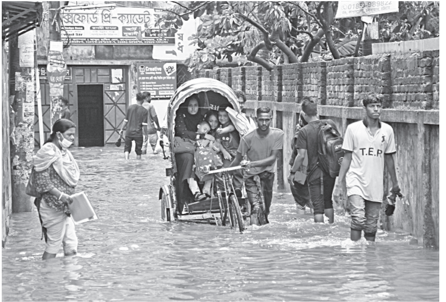
The relief from sweltering heat was short lived in Chattogram, as 153 mm rain was enough to inundate the city. Vehicular movement came to a standstill and few rickshaws were seen on roads. In many places, office-goers and students had to wade through knee-to-waist-deep water to reach their destinations. This photo was taken in Chawkbazar area yesterday.

Anonymous victim Whose house was vandalised