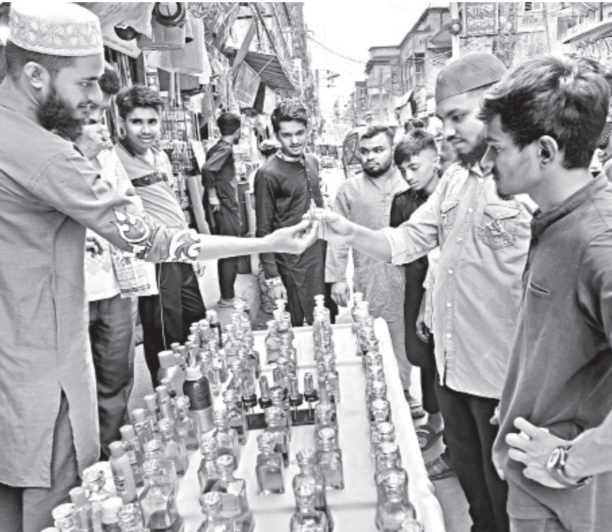
An "ator (perfume)" seller hands out a sample to a customer to have a smell in Barishal's Chawkbazar area. Traditionally during the time of Eid, these sellers are seen in front of different mosques, selling 30 to 60 ml bottles at a price ranging from Tk 120 to 600. This photo was taken yesterday.

Notably, the old jail near Dhopadighi remains as a backup jail, since a new jail at Badaghat in Sylhet Sadar upazila is being used as the main jail since January 2019.