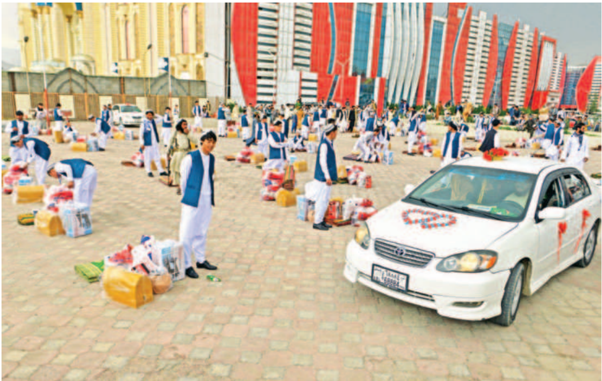
Grooms stand along with the gifts outside the wedding hall during a mass marriage ceremony in Kabul yesterday. Dozens of Afghan women concealed in thick green shawls were married off in an austere mass wedding in Kabul, in a ceremony attended by hundreds of guests and gun-toting Taliban fighters.