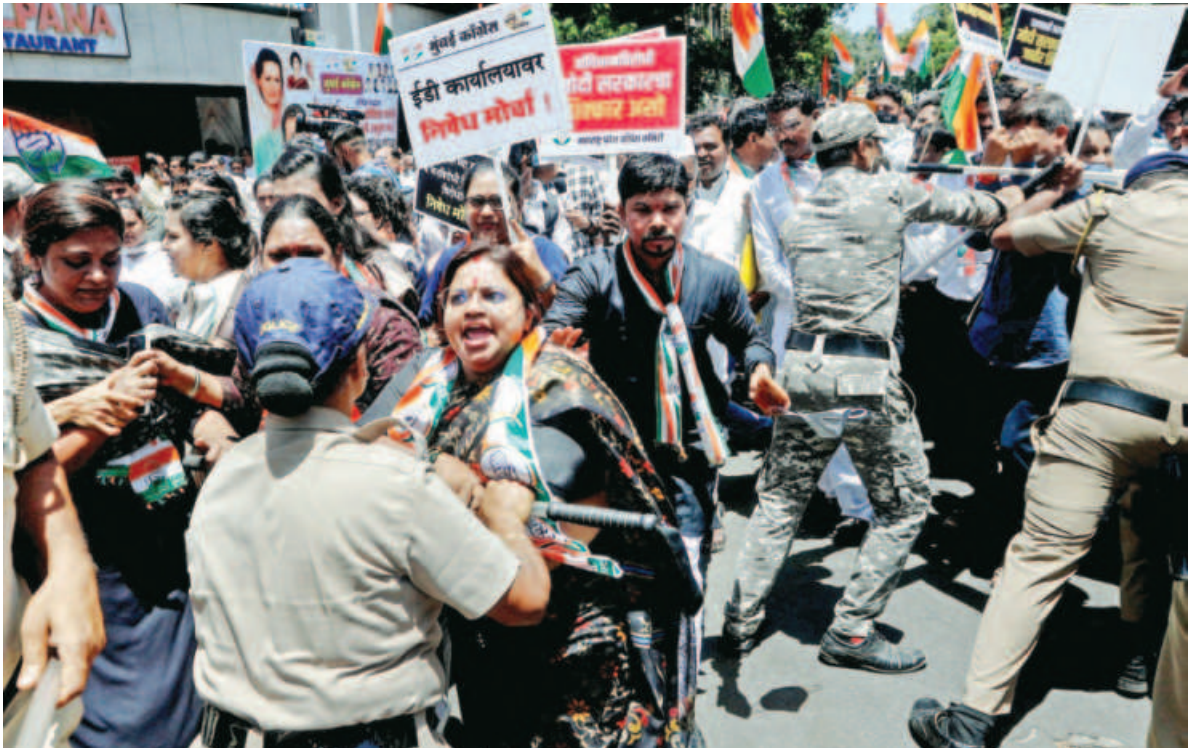
Police officers attempt to stop supporters of India's main opposition Congress party as they attempt to reach the Enforcement Directorate office during a protest after party leader Rahul Gandhi was summoned by the Enforcement Directorate in a money laundering case, in Mumbai, India, yesterday.