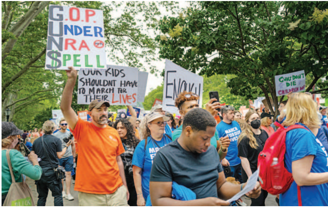
People march across the Brooklyn Bridge to protest against gun violence in the March for Our Lives march and rally in New York City, on Saturday. Across the country in various cities, thousands gathered to demand meaningful gun laws following the recent shootings from Uvalde, Texas, to Buffalo, New York.

Satellite-based methods for spotting methane leaks over land have developed rapidly in