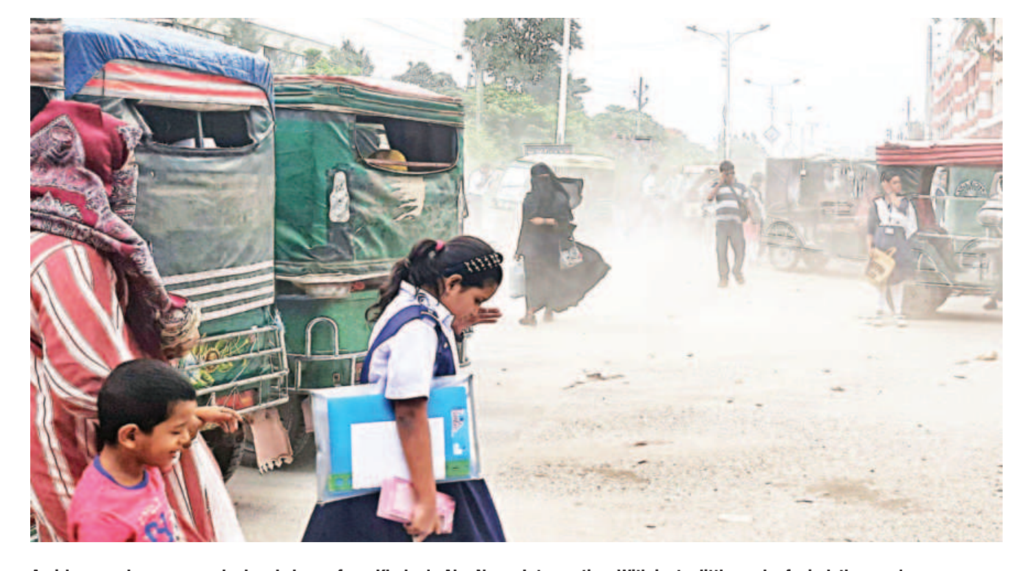
A girl covers her eyes as she heads home from Khulna's Abu Naser Intersection. With just a little gush of wind, the area's accumulated dust pollutes the air, causing much peril to commuters. This photo was taken recently.

The woman is from Bhandardaha village. The medical board collected her samples for testing yesterday after she was brought there on Friday.