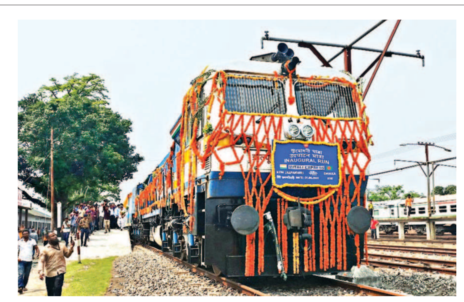
The Mitali Express began its journey from New Jalpaiguri after railways ministers of India and Banglades flagged it off virtually yesterday. This is the third passenger train between the two countries.