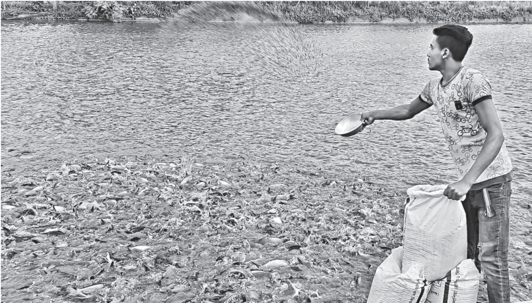
Hundreds of farmed fish gather near the bank and jump out of the water as a farmer throws food into the waterbody. He cultivates cultures of rui, katla, pangash and tilapia in this reservoir. This photo was taken in Khulna's Dumuria upazila recently.