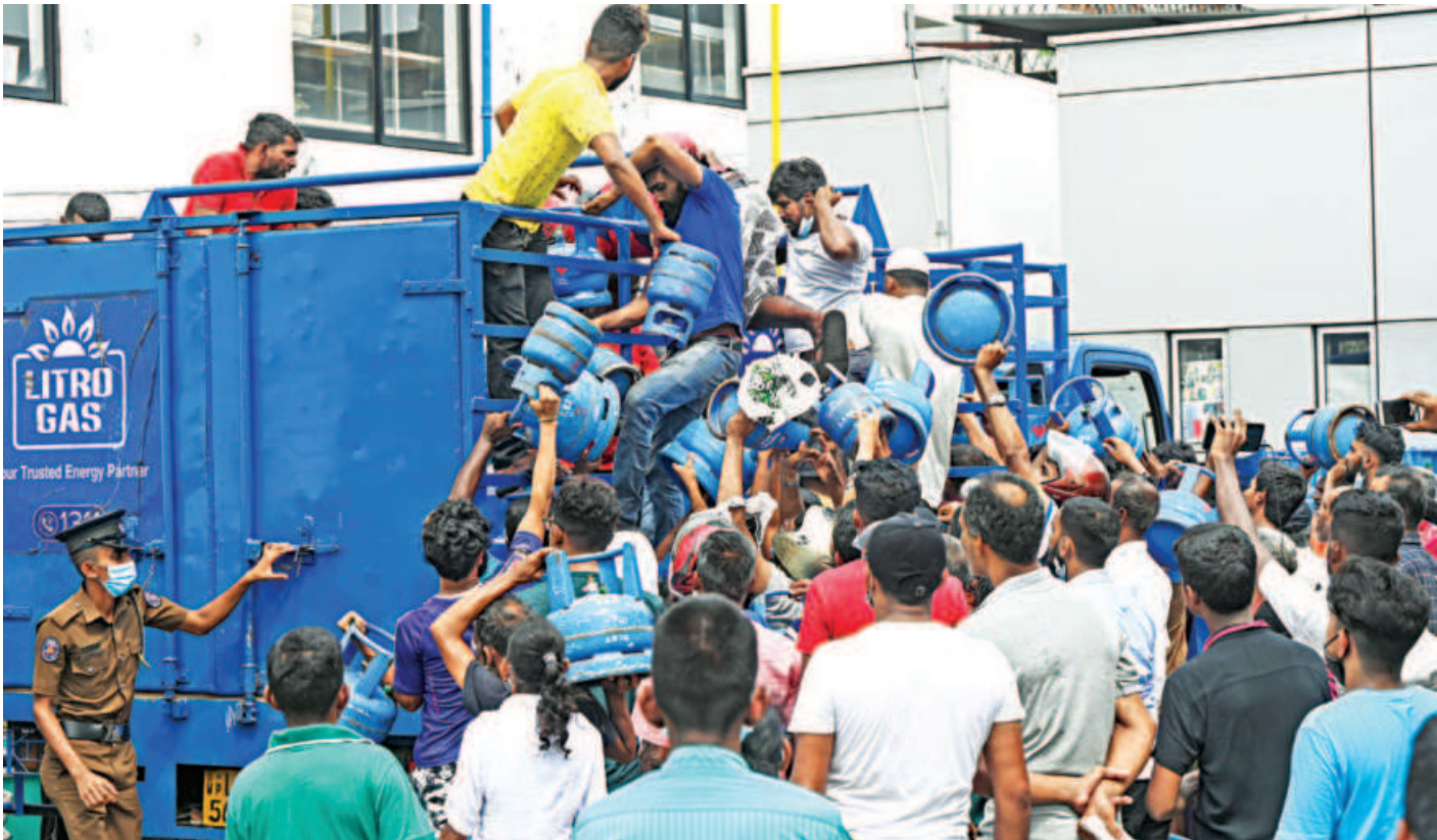
Enraged crowd, who had been waiting in line overnight for supplies, loot a truck transporting cooking gas cylinders in Colombo, Sri Lanka yesterday. Outnumbered police watched helplessly as men climbed onto the truck and got away with 84 cylinders of gas, officials said.

But dozens of people carried hand-written placards and chanted slogans demanding that “thieves” be banned from the sacred city, 200 kilometres (125 miles) north of Colombo. “We will worship you if you stand down (as Prime Minister) and leave,” one man shouted. Heavily armed Special Task Force (STF) commandos were deployed while police moved to clear the road for Rajapaksa’s convoy of six vehicles. Officials said the premier would return to the capital by helicopter. Several major roads in the country are blocked by people protesting the lack of cooking gas, petrol and diesel.