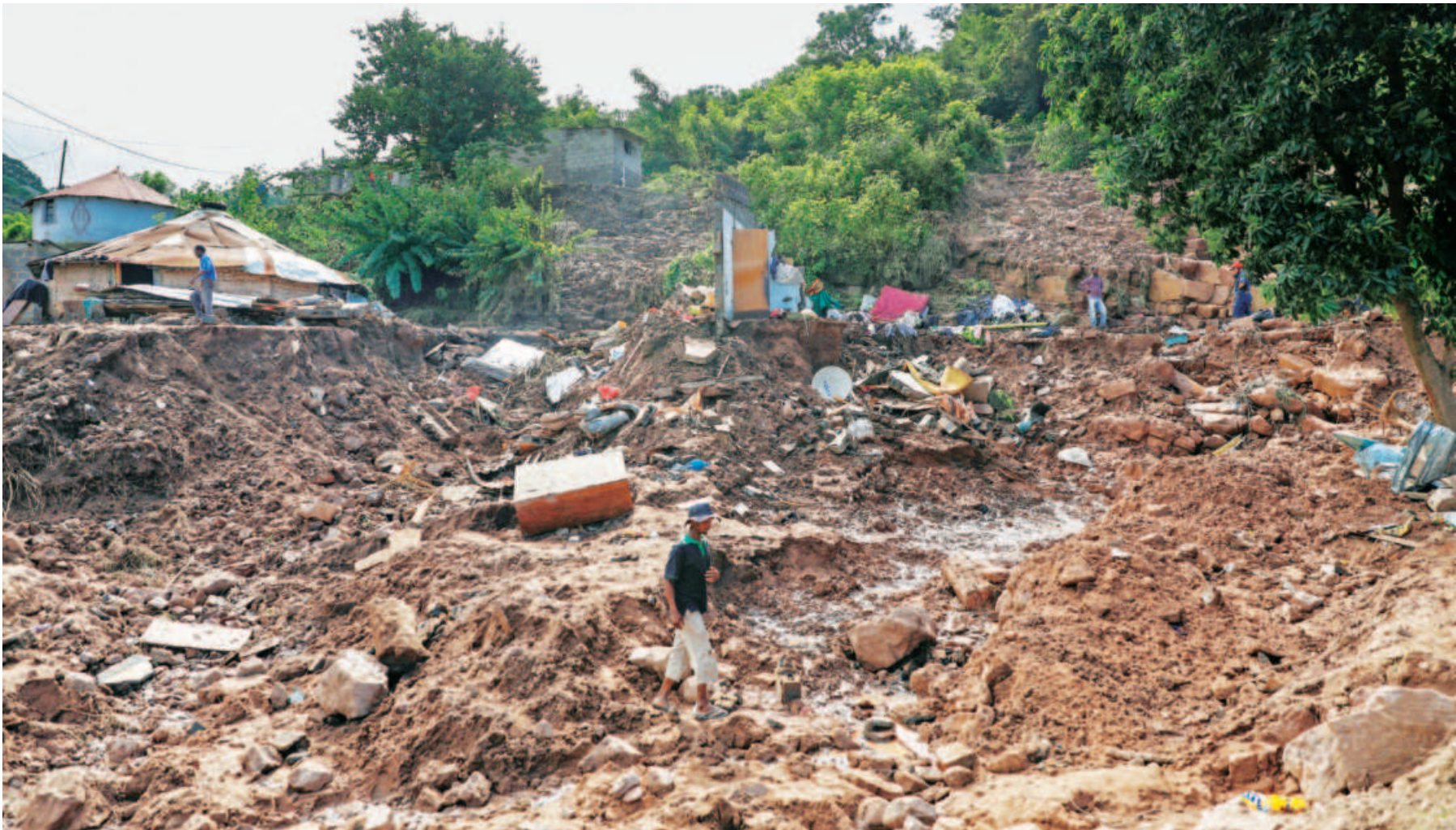
A man walks past the remains of a house at KwaNdengezi township outside Durban, south Africa, on Friday. South Africa's flood-ravaged east was hit by more rain yesterday after the deadliest storm to strike the country in living memory killed nearly 400 people and left tens of thousands homeless.