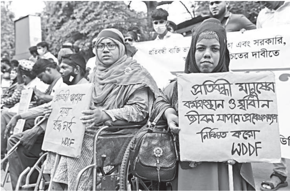
With demands to increase their monthly allowance to Tk 2,000 and ensuring job opportunities for them, a group of people with disabilities forms a human chain in front of National Museum at Shahbagh in the capital yesterday. “Bangladesh Society for the Change and Advocacy Nexus” organised the event.