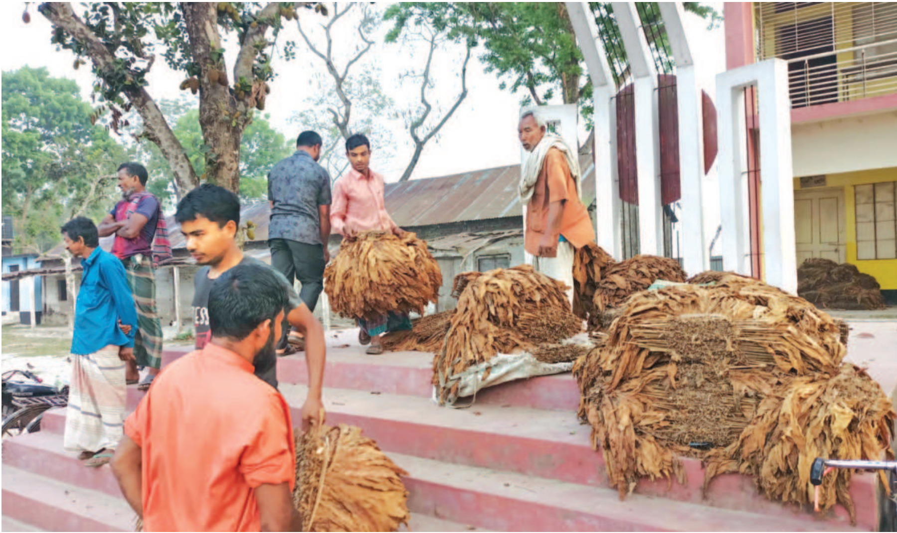
Tobacco growers and buyers using the Shaheed Minar of Durakati Government Primary School in Lalmonirhat Sadar upazila as their marketplace even on Independence Day yesterday.