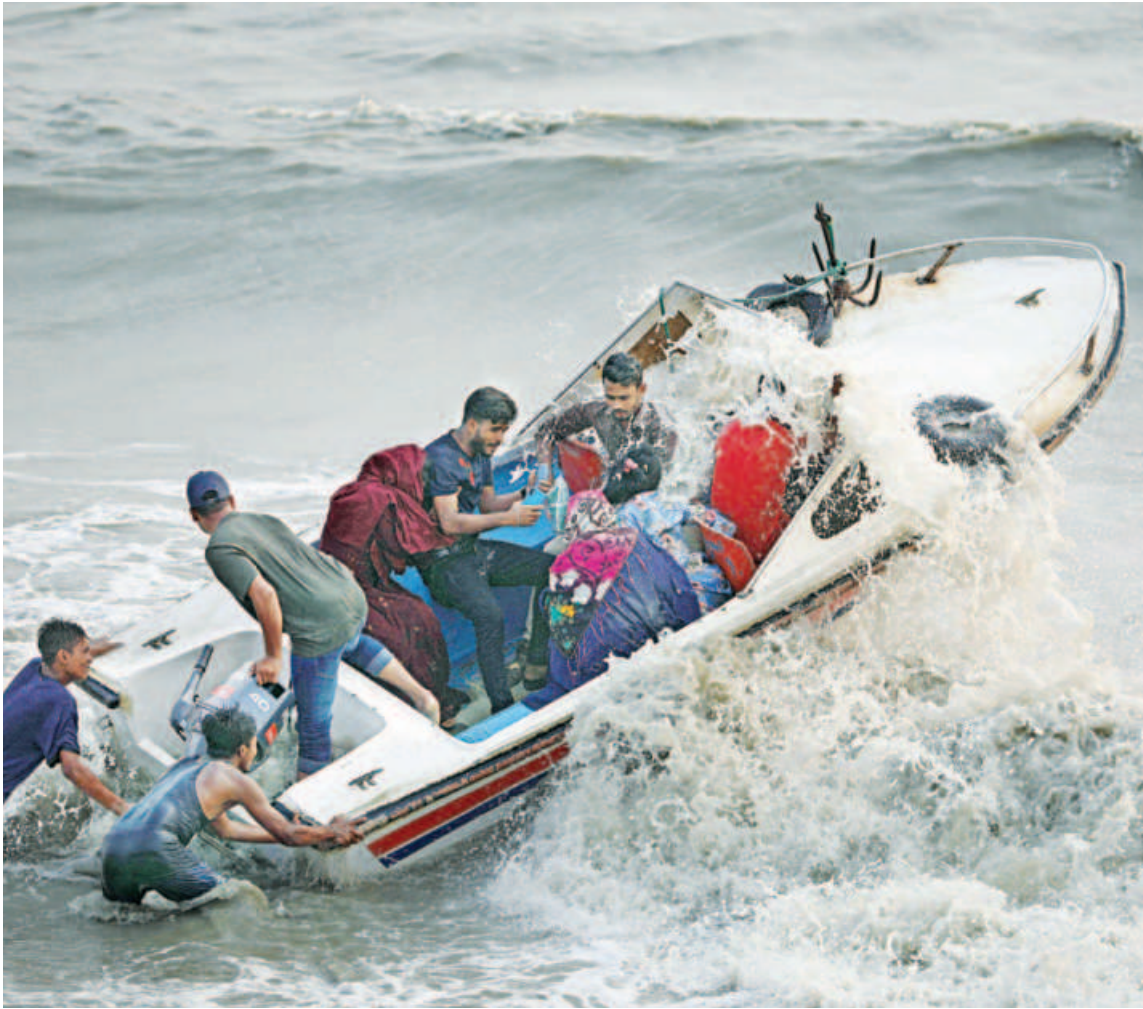
With passengers having no safety equipment, such as life jackets, on, two men seem to be putting all their strength to push a speedboat out into the sea from Patenga beach in Chattogram for a five-minute tour yesterday. While each person has to pay Tk 100 for such trips, they don't seem to be provided with the security that is needed out in open waters.