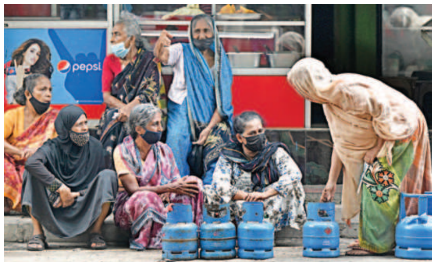
People queue to buy Liquefied Petroleum Gas (LPG) cylinders following shortages of essentials, in Colombo, Sri Lanka yesterday. Beijing is considering a request for another $2.5-billion loan package from crisis-hit Sri Lanka.