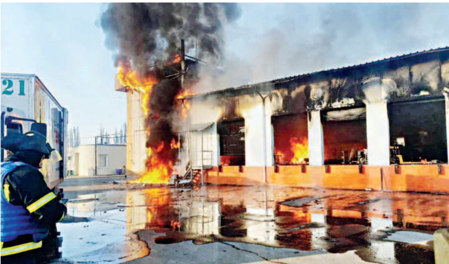
A view shows a warehouse of goods damaged by shelling, as Russia's attack on Ukraine continues, in Sievierodonetsk Ukraine, in this handout picture released yesterday. The war between Ukraine and Russia, two of the world's top crop producers, could lead to a food crisis "on the global" scale, French Farming Minister Julien Denormandie said in Brussels yesterday ahead of a E agriculture meeting.

Asked Sunday on CBS whether China might send money or weapons to Russia, Ambassador Qin Gang spoke about the present, saying: "There is disinformation about China providing military assistance to Russia. We reject that."