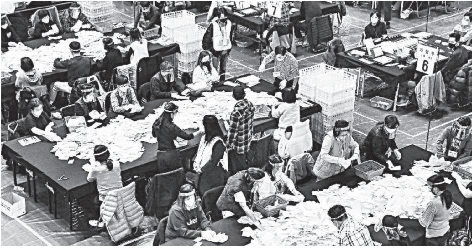
South Korean election officials sort voting papers for ballot counting in the presidential election at a gymnasium in Seoul yesterday. The election appears to have produced a dead heat between the two main candidates vying to lead the country for the next five years, according to exit polls. Conservative Yoon Suk-yeol, with 48.4 percent, is slightly ahead of liberal Lee Jae-myung, with 47.8 percent, an exit poll jointly conducted by three television networks showed.