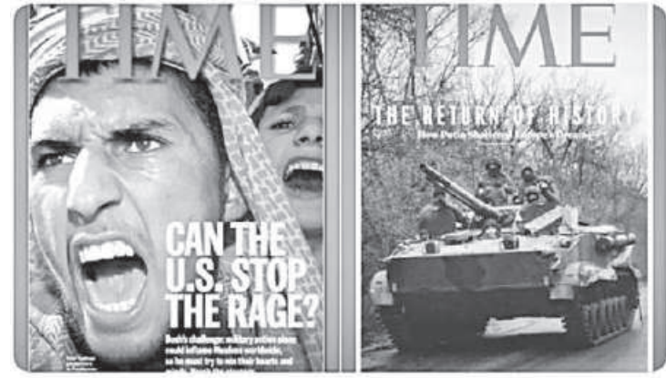
12:27 AM · Feb 26, 2022 · Twitter Web App

On the left is TIME after Bush invaded Afghanistan. On the right is TIME after Putin invaded Ukraine. Spot the difference.