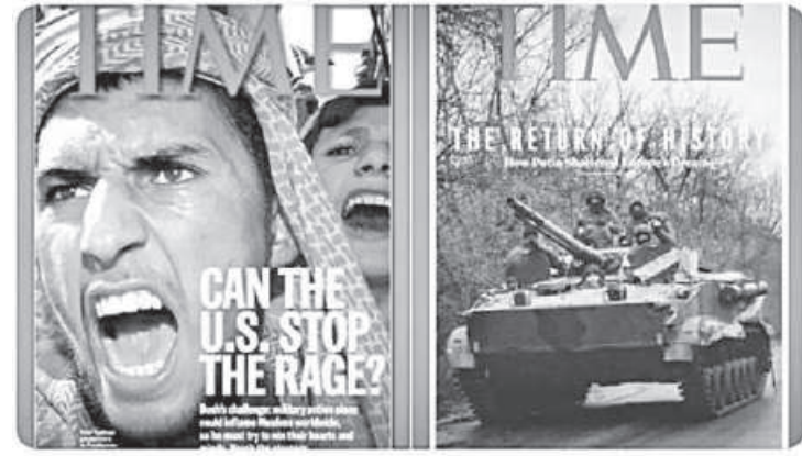
12:27 AM · Feb 26, 2022 · Twitter Web App

On the left is TIME after Bush invaded Afghanistan. On the right is TIME after Putin invaded Ukraine. Spot the difference.