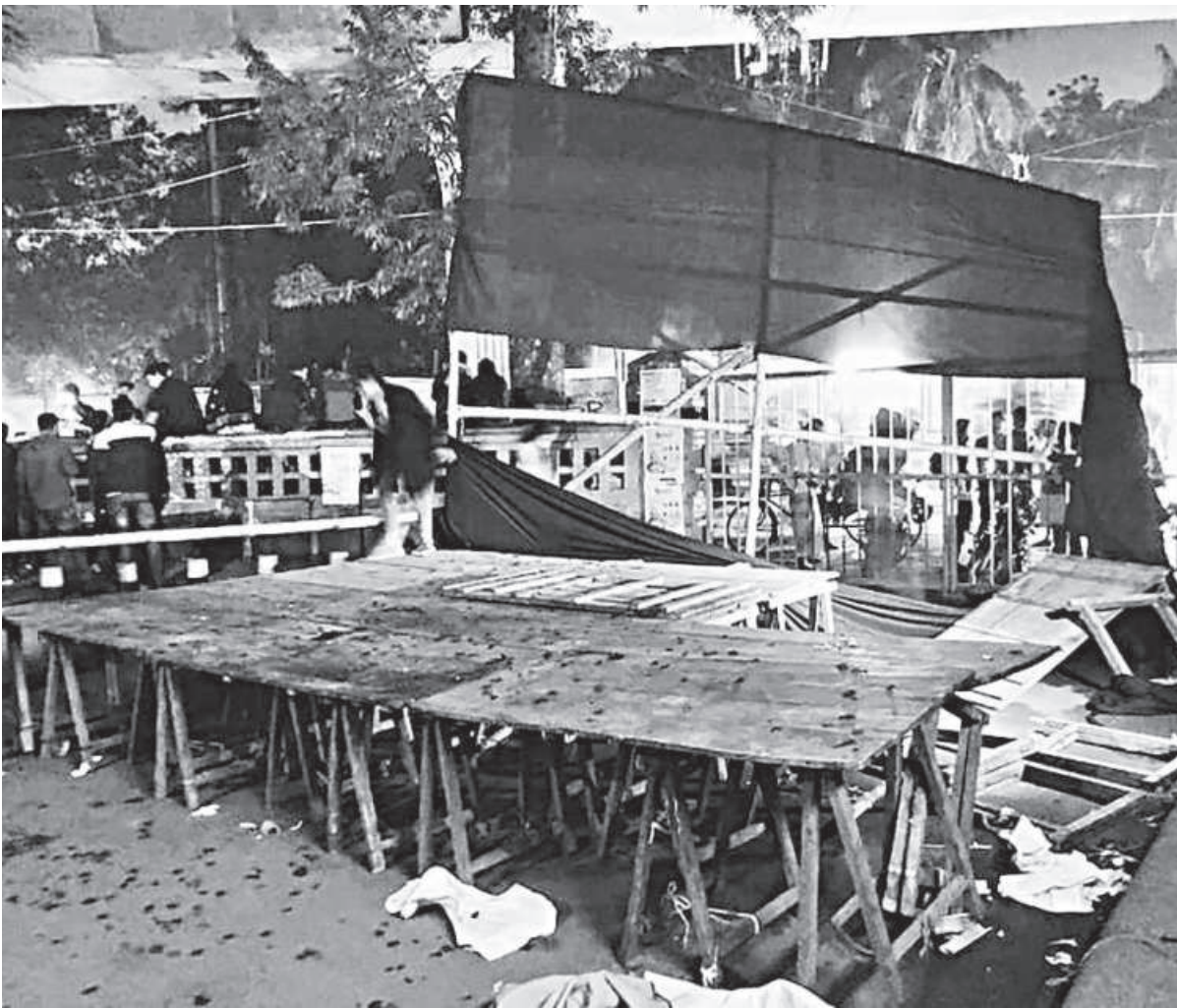
A view of a damaged stage at Dhaka University's TSC area where a Qawwali programme was scheduled to take place on January 12, 2022.