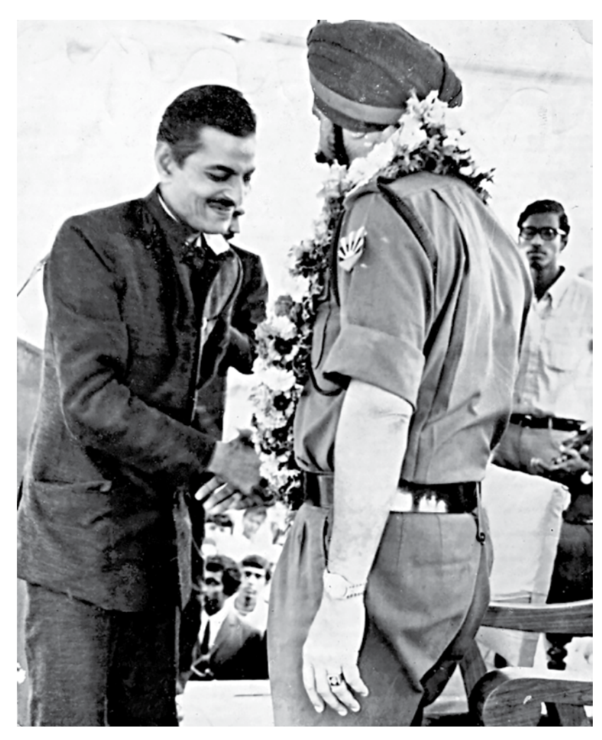
Mohiuddin Ahmed with Lt Gen Jagjit Singh Aurora.

Mohiuddin Ahmed's prison letters are modest in scope, but they shine a bright light on not only the state of a freedom fighter's mind, but also an illogical war's dehumanising effects on people.