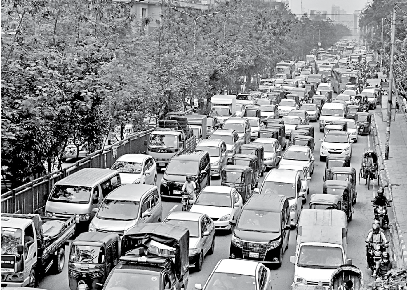
The capital saw a sudden increase in traffic congestion yesterday, possibly due to the constant drizzle throughout the first day of the week. This photo was taken from the Moghbazar-Tongi diversion road.