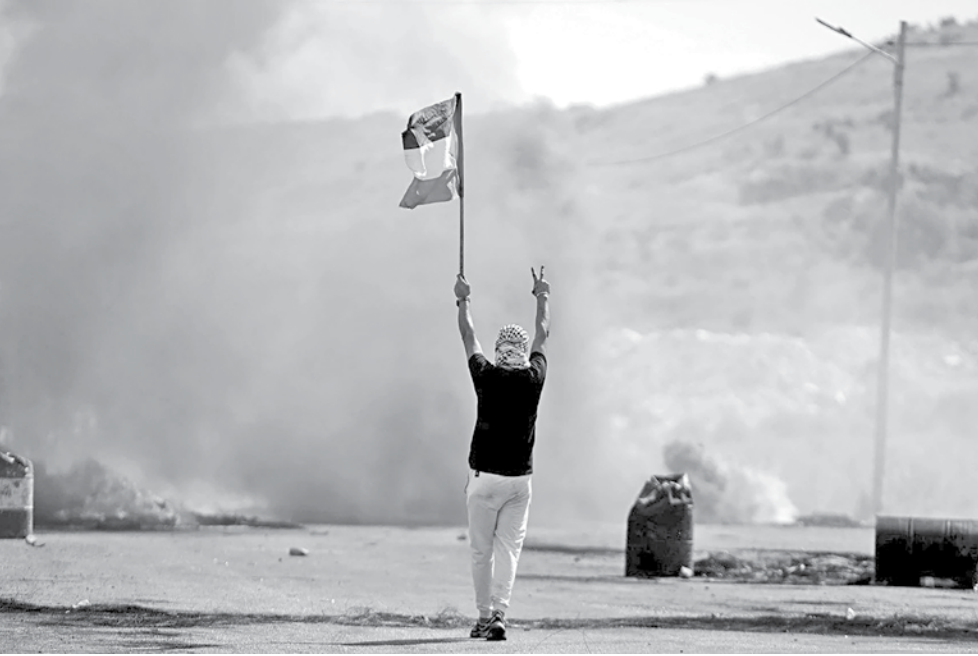
A demonstrator holds a Palestinian flag during a protest at the Hawara checkpoint near Nablus.

and Jewish states. The State of Israel was created on May 14, 1948, leading to the end of the British Mandate of Palestine and sowing the seeds of the first Arab-Israel War. By the time the nine-month-long war ended on March 10, 1949, with Israel emerging as the victor, the Palestinians helplessly endured the Nakba or “Catastrophe.” Around 750,000 Palestinians were displaced during the Nakba, with about 500 Palestinian villages being depopulated. Over a span of a few months, the native Palestinians became outcasts in their own lands. Those who fled the war, lost their right to return home, most of them turning into poor refugees in neighbouring countries, with a new nightmare unfurling in their lives. The result of the first Arab-Israel War was the division of the territory into three chunks: the biggest was Israel, followed by the smaller Gaza Strip, and the West Bank. This was only the beginning of a new era of subjugation, persecution and dispossession of the Palestinians at the hands of Israel. Over the years, the displacement of the Palestinians continued as Israel became more aggressive and more vicious in its apartheid-like misadventures. To this day, Israel keeps