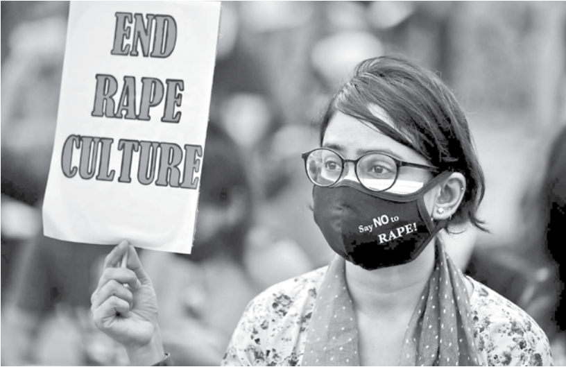
A woman holds up a placard, asking to end the rape culture that is rampant in the country, during a protest in front of Jatiya Sangsad Bhaban in Dhaka.