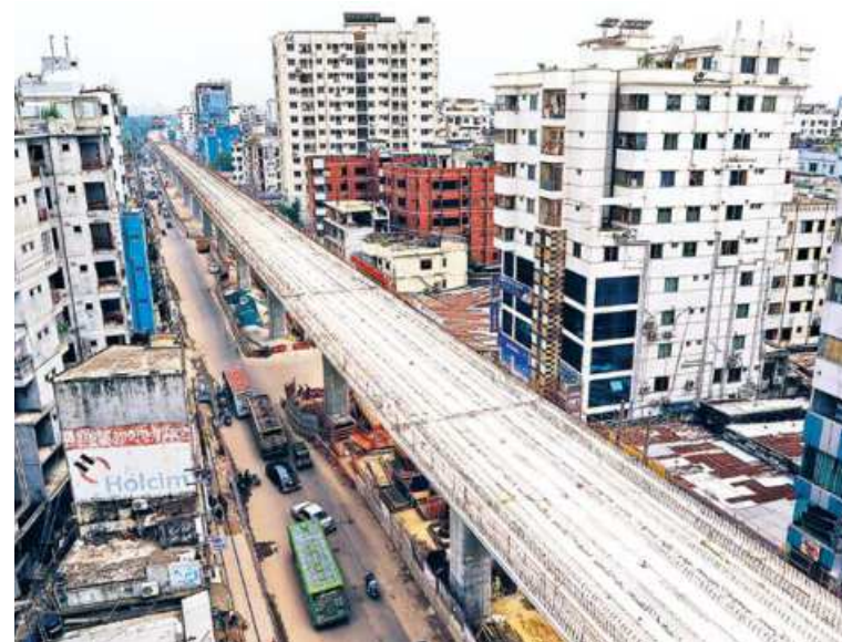
A view of the Dhaka Metro Rail project.