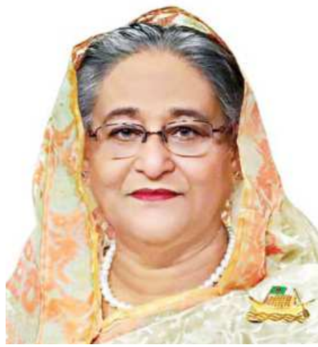
Prime Minister Sheikh Hasina

"We've received investment proposals of $27.07 billion in the economic zones."