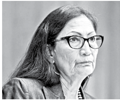
DEB HAALAND US SECRETARY OF INTERIOR

The Interior Department report, however, said the current program "falls short of serving the public interest" and called for new rules to boost royalty rates, bonding rates, and other fees for producers.