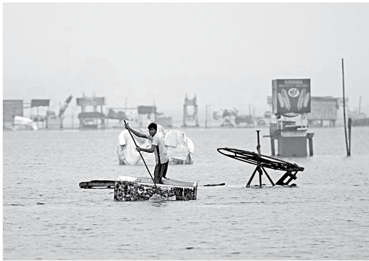
A youth uses a fridge as raft along a flooded section of Marina beach following a heavy monsoon rainfall in Chennai, India yesterday.