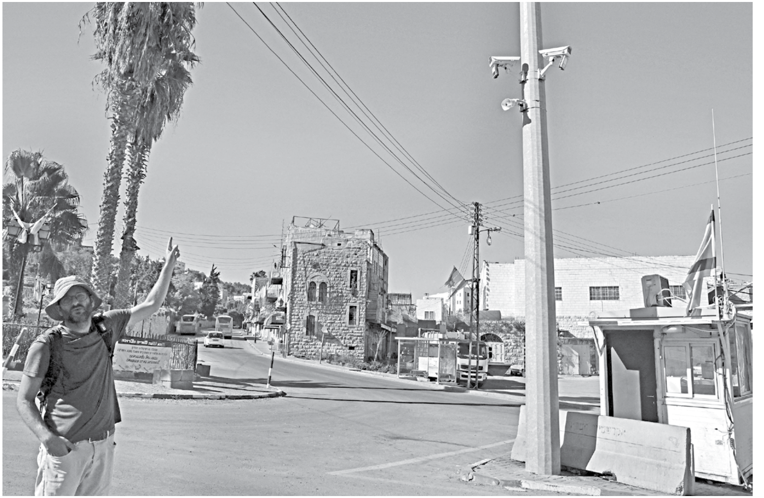
A man points at surveillance cameras in the flashpoint Palestinian city of Hebron yesterday. Israel's army has deployed a sweeping personal data collection programme using facial recognition technology targeting Palestinians in parts of the occupied West Bank, an organisation that works with former soldiers said.