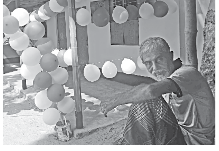
house to the family on Saturday.

Approval has already been given to upgrade the single rail track between Darshana and Khulna city rail stations into double tracks and