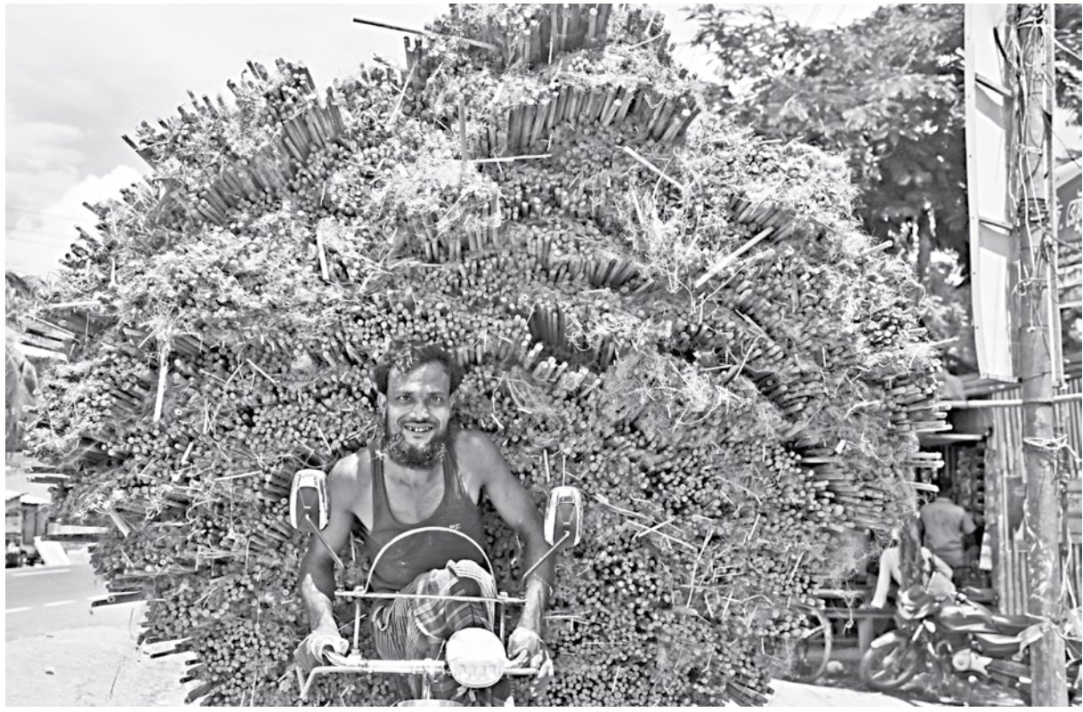
The fibre that is extracted from a jute plant is known as jute, but what happens to the rest of the plant? After being soaked in water for 15-20 days, the plant is separated into fibre, stem, and ribbons. These ribbons are then dried into sticks and used for other things, like building scaffolding for betel leaf farms. This photo was taken recently from Barishal's Bakerganj upazila.