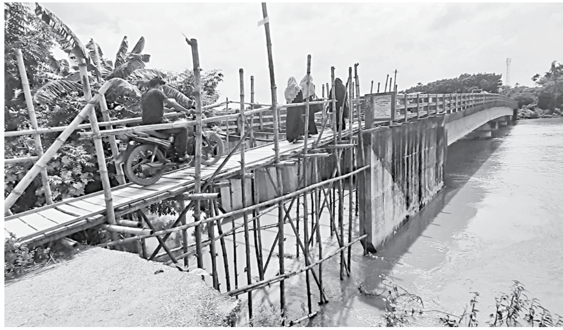
Vehicular movement except bicycle and motorcycle remains suspended for 14 months as one side of the approach road of the bridge on Louhajang river in Mogra union in Tangail Sadar upazila lies damaged.