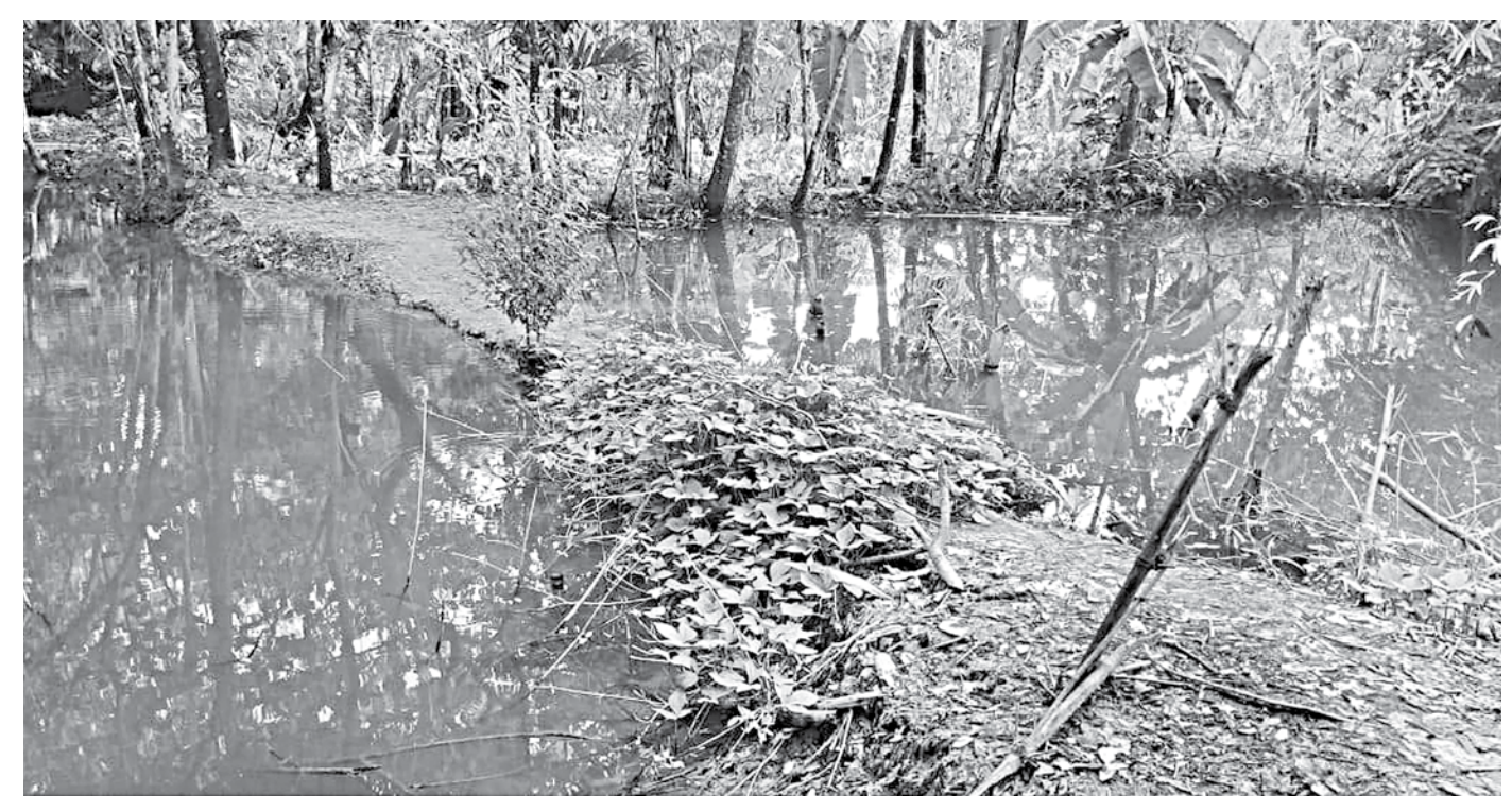
Though it may look like a narrow strip of land separating two ponds, but in reality, it is a barrage made through Nayabhanguni canal in Patuakhali's Rangabali upazila. As many as forty such barrages were built in the public canal over the last ten years.

UNO Mashfaqur Rahman said the flow of water in a government canal cannot be obstructed and necessary action would be taken against all accused once the investigation report is received.