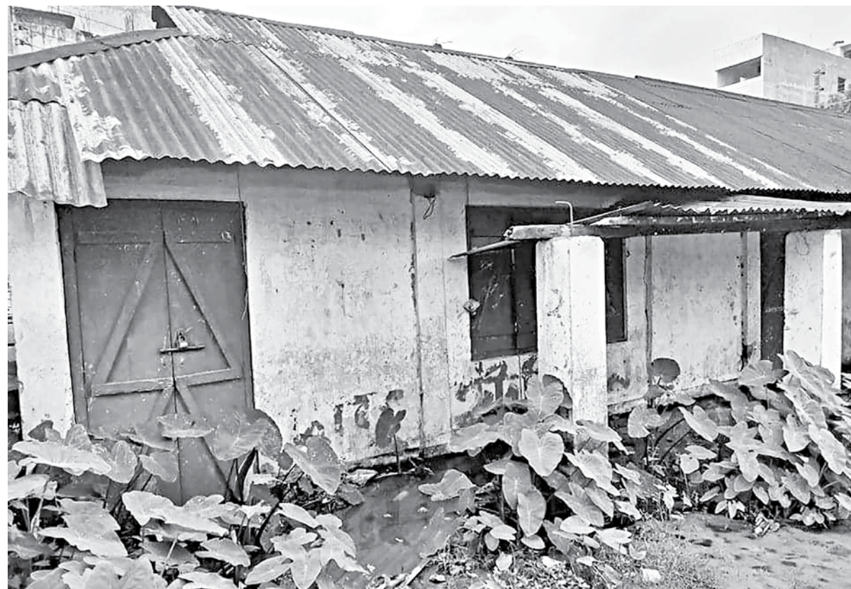
Due to lack of preservation, Kulaura Public Library has now become a garbage dump and waterlogged. The collection of valuable books written by eminent authors has also been completely destroyed.