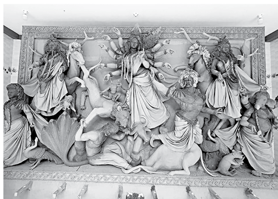
Sculptors are busy giving the finishing touches to idols ahead of the Durga Puja, the biggest religious festival of the Hindu community. The photo was taken from Sahabari area in Tangail's Basail upazila.