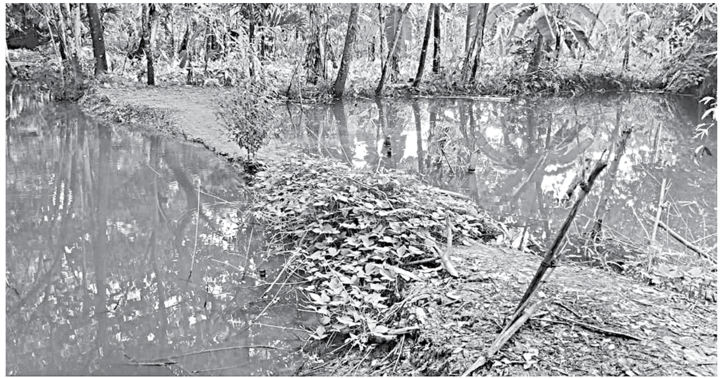
Though it may look like a narrow strip of land separating two ponds, but in reality, it is a barrage made through Nayabhanguni canal in Patuakhali's Rangabali upazila. As many as forty such barrages were built in the public canal over the last ten years.

UNO Mashfaqr Rahman said the flow of water in a government canal cannot be obstructed and necessary action would be taken against all accused once the investigation report is received.