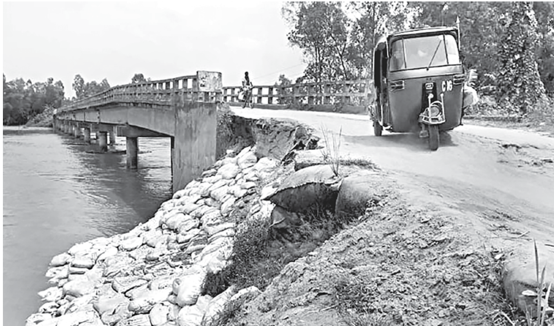
The approach road of the bridge on Charabari-Torabganj road connecting five unions of the char areas with the district headquarters lies in a precarious condition.

However, the approach roads of the important bridge were damaged