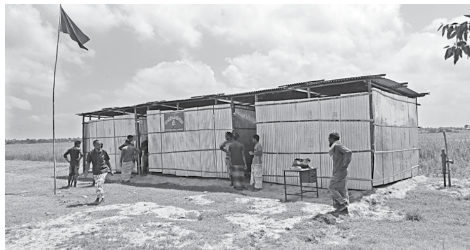
The temporary tin-roofed structure built for West Haldibari Government Primary School in Hatibandha upazila of Lalmonirhat.

He also hoped that necessary government funds will be allocated in this regard within this year.