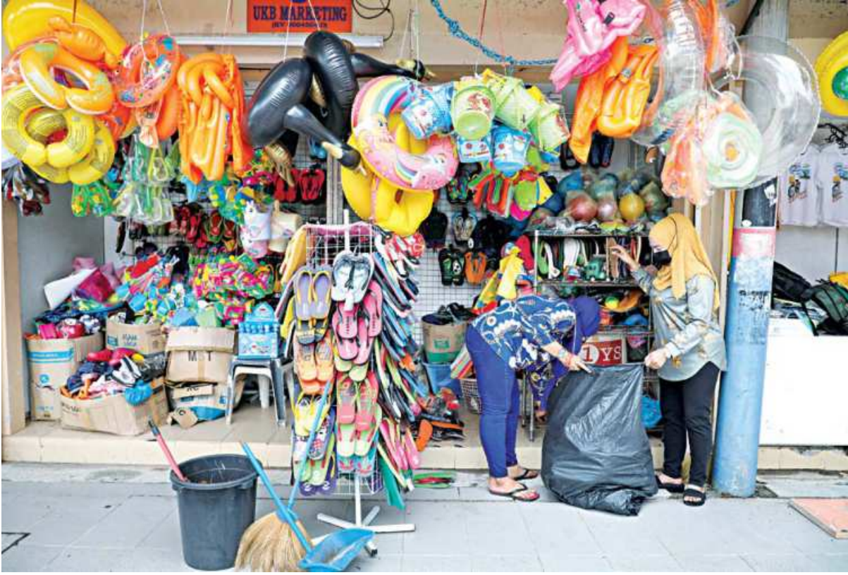
Vendors tidy up a shop, as Langkawi gets ready to open to domestic tourists from today, amid the coronavirus disease pandemic in Malaysia yesterday.

He added: "Not because we are trying to trick anybody, but because we want something that is functionally equivalent to the mammoth, that will enjoy its time at -40C, and do all the things that elephants and mammoths do, in particular knocking down trees."