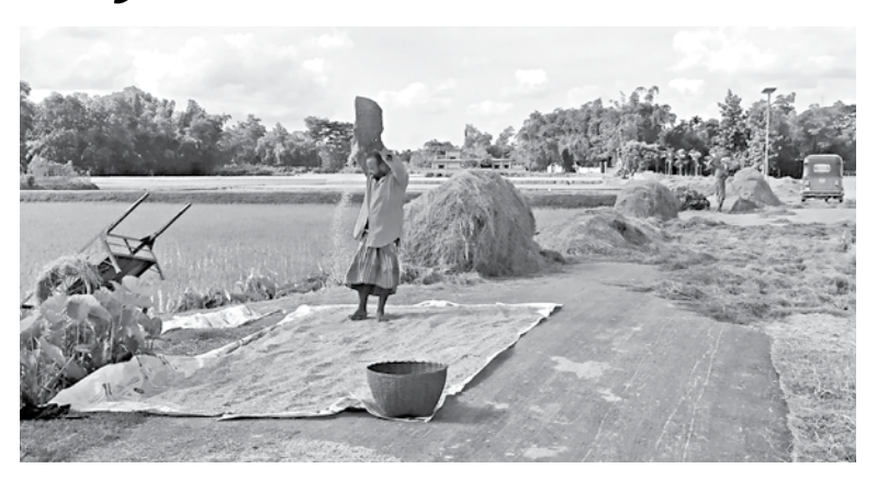
A worker in Mulvibazar's Kamolganj upazila using wind to separate undeveloped Aus grains before drying.

Kumar additional director of DAE in Sylhet, "Various pragmatic steps undertaken by the government had encouraged farmers to expand Aus cultivation, but the production of the crop fell due to the drought."